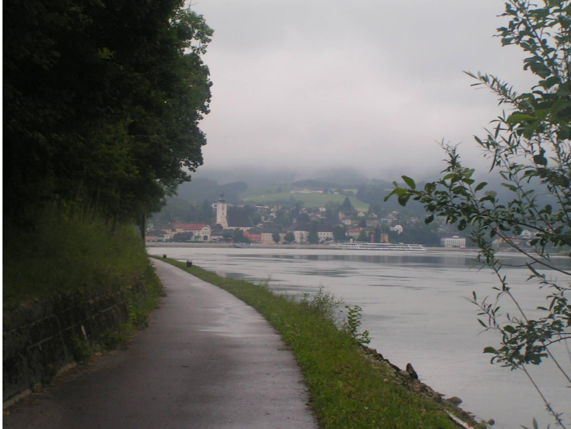
Le Danube sous la pluie