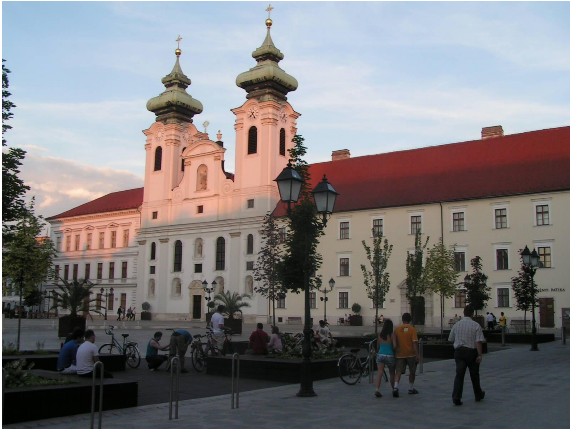
Eglise GYOR Hongrie