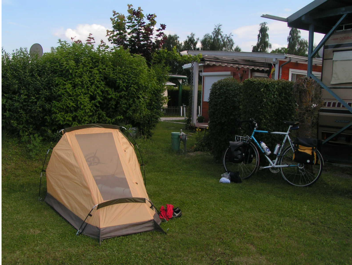
Ma cabane vue sur les étoiles