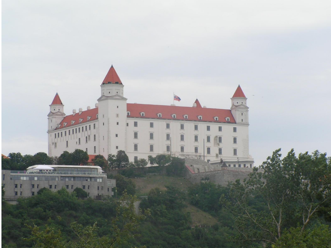
Bratislava – le château