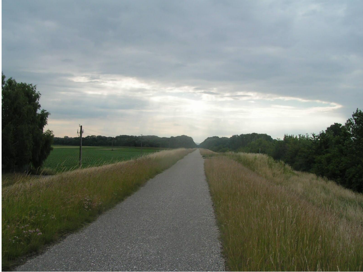
Sortie de Vienne