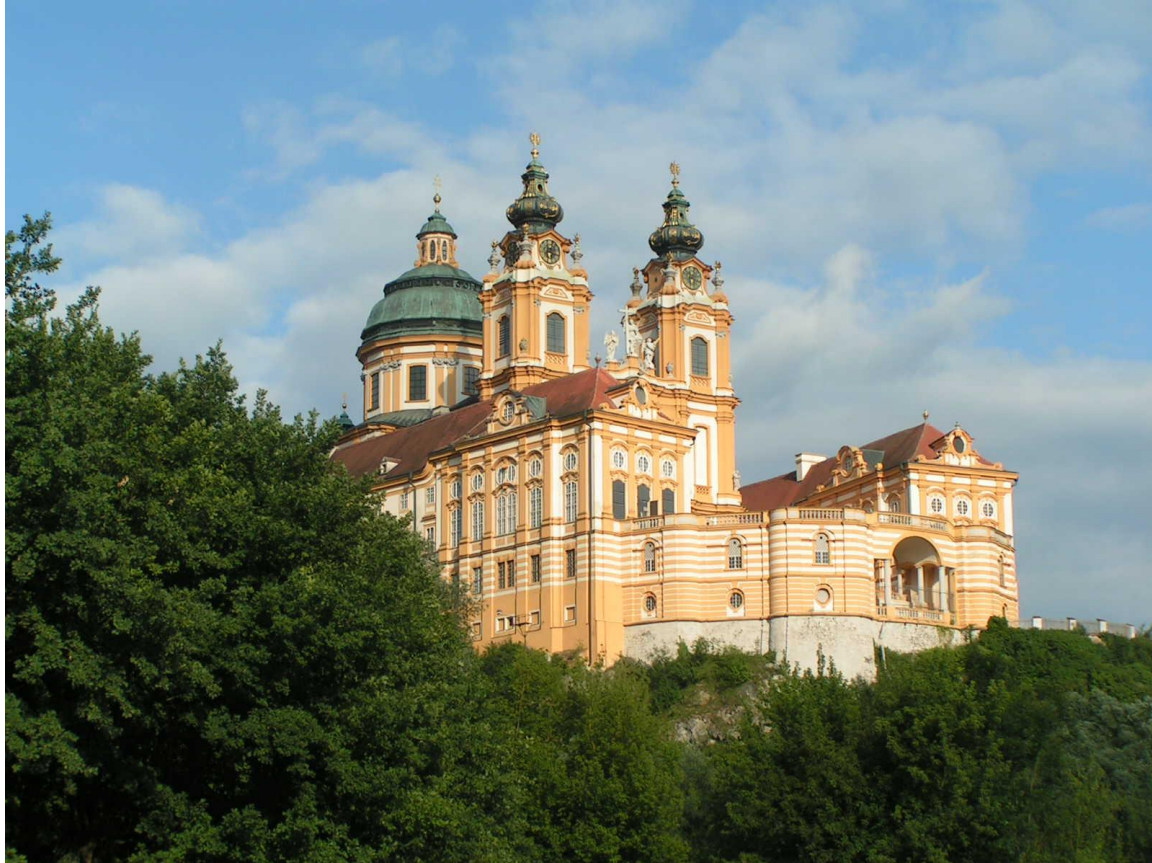
Melk - Autriche