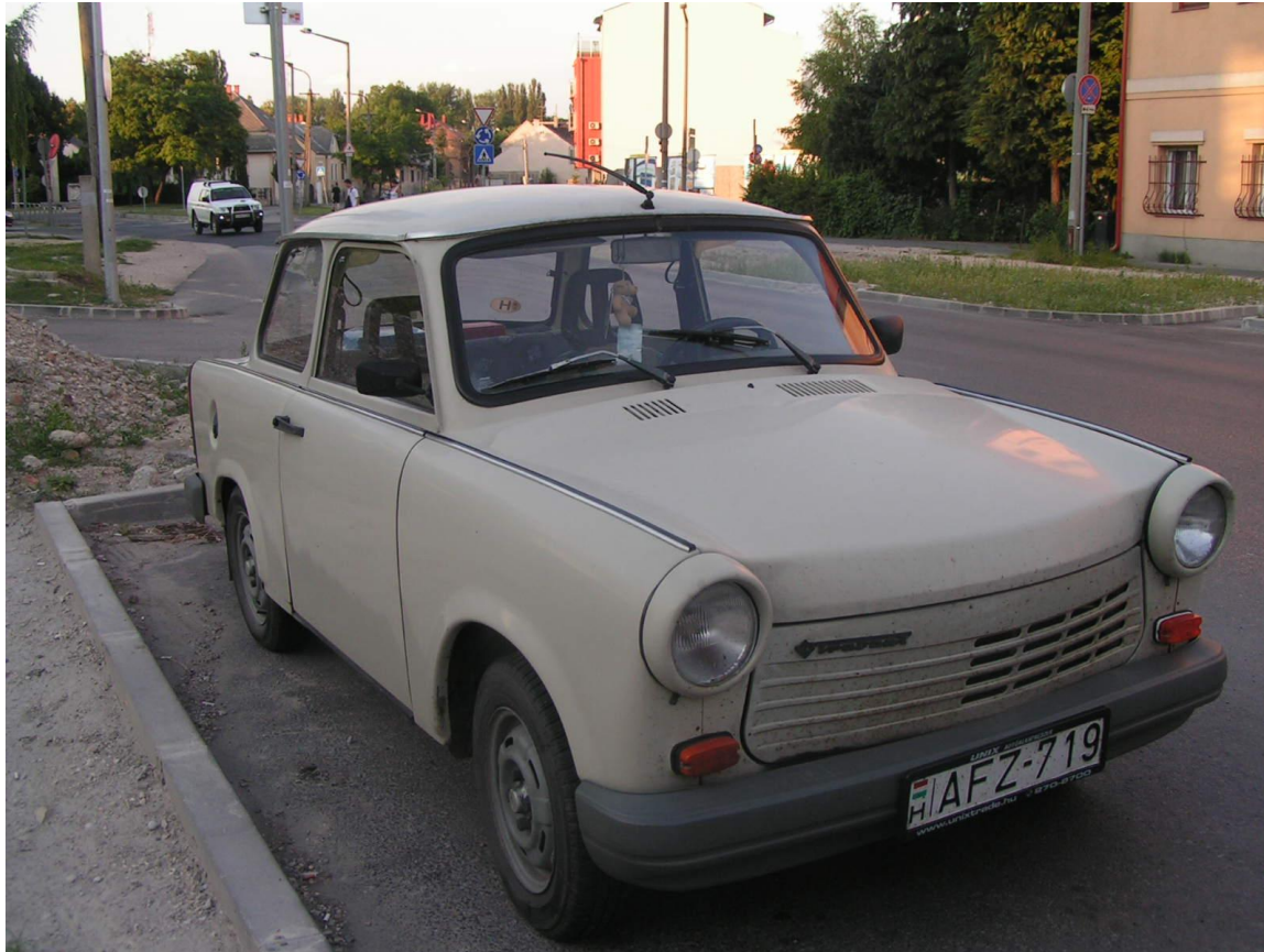
Une traban en Hongrie