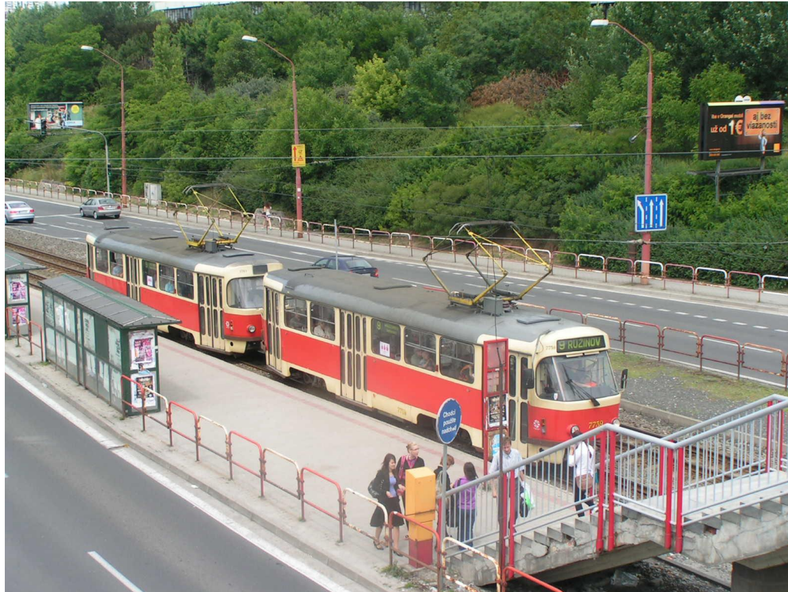
Bratislava - Slovaquie