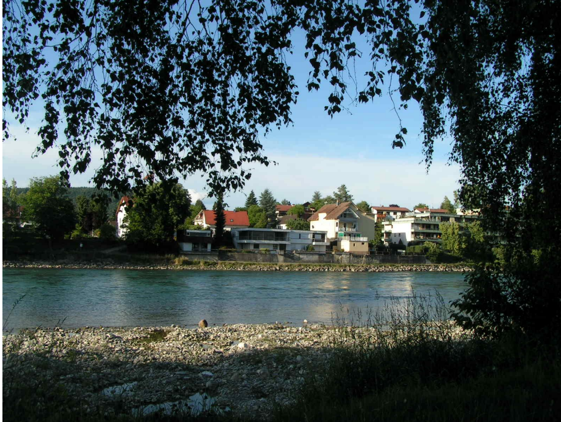
Les bords du Rhein